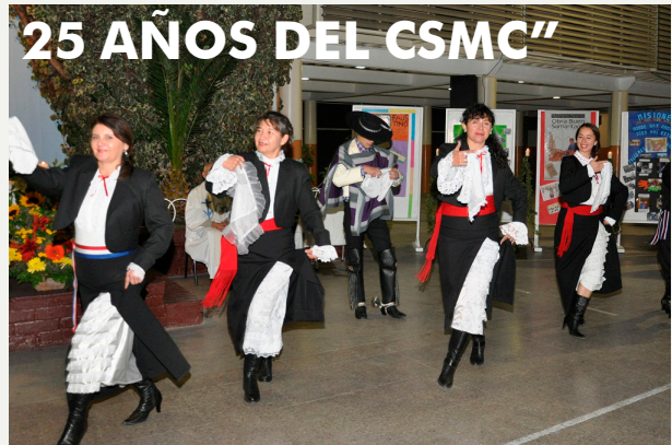
25 AÑOS DEL CSMC"