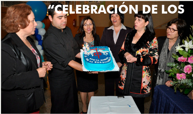
"CELEBRACIÓN DE LOS