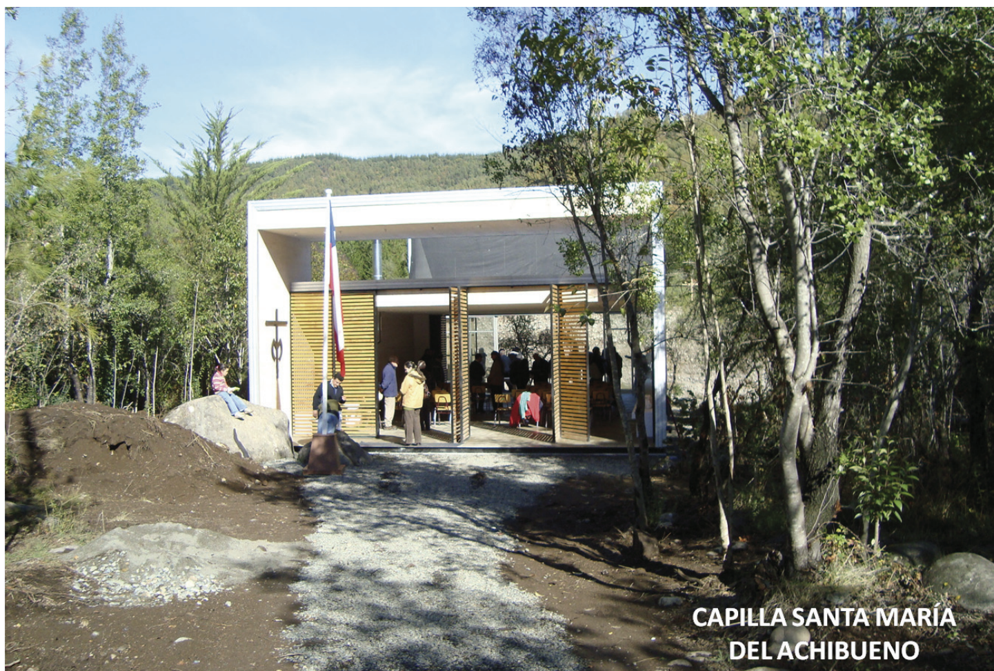
CAPILLA SANTA MARÍA DEL ACHIBUENO

Una educación para crecer, creer y compartir