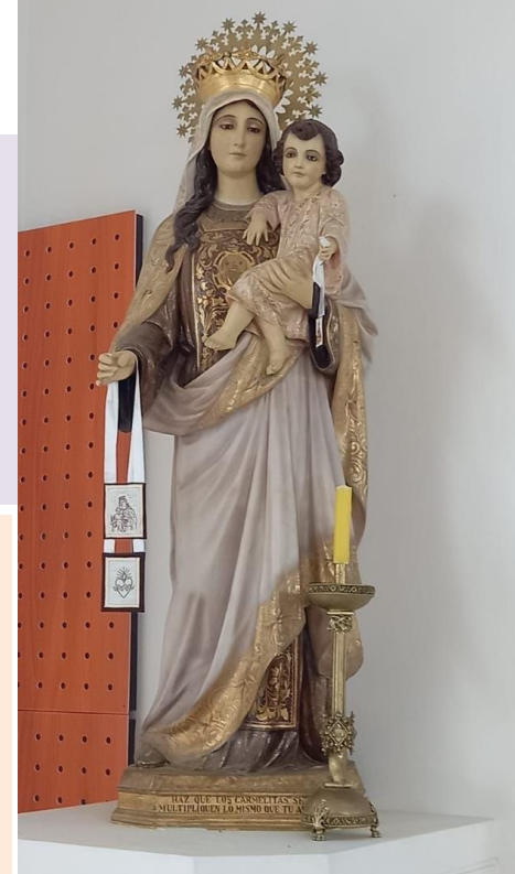
Imagen de Nuestra Señora del Carmen. Capilla Colegio Nuestra Señora del Carmen de Melipilla