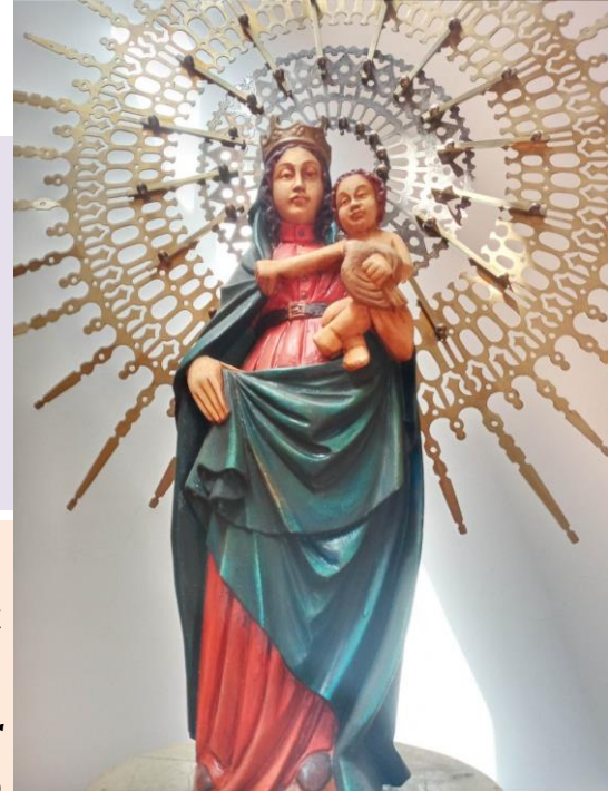
Imagen de la Virgen Del Pilar. Capilla Colegio Santa María de la Cordillera