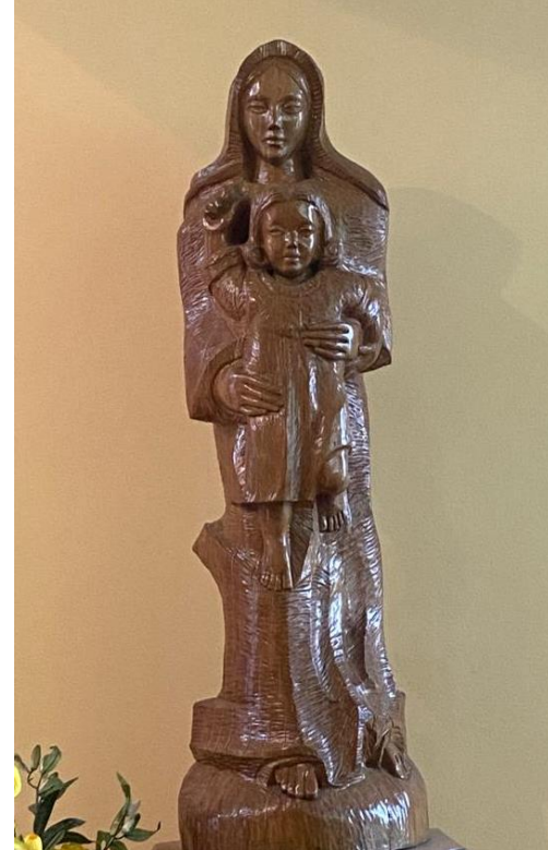
Imagen de la Virgen y el Niño Capilla Instituto Linares

“Conságrate a Dios y a María. En medio de la tormenta, no pierdas de vista la estrella que te