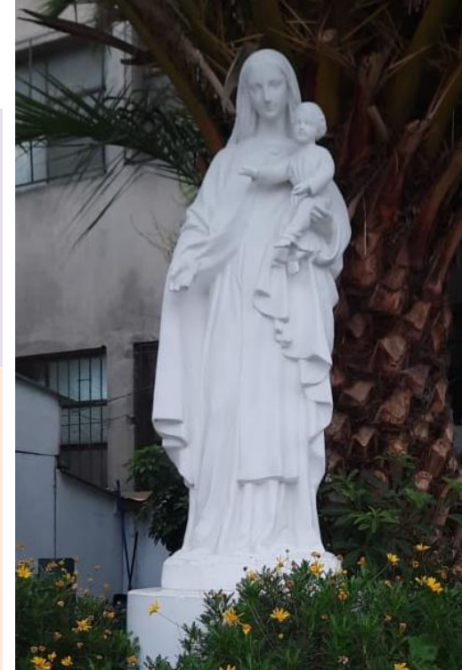
Imagen del Patio de la Virgen Colegio Parroquial San Miguel.