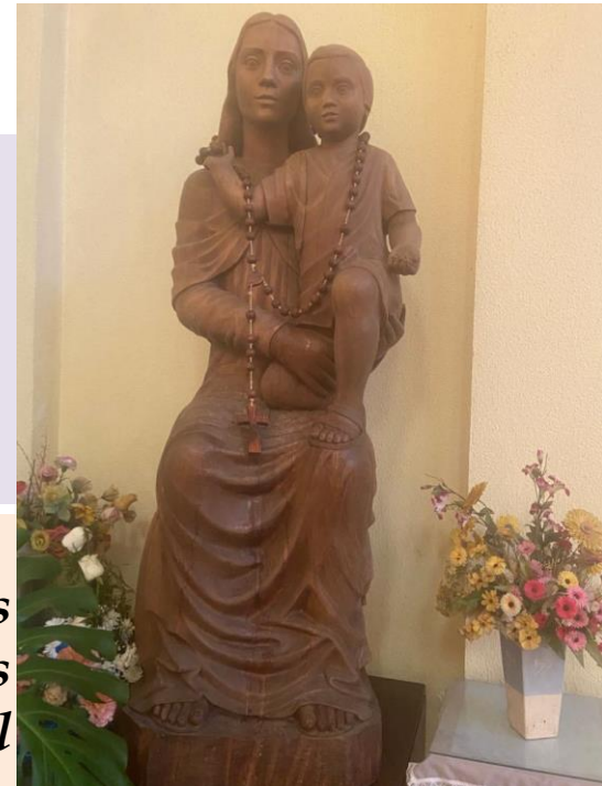
Imagen de la Virgen Nuestra Señora del Maule. Catedral de Linares.