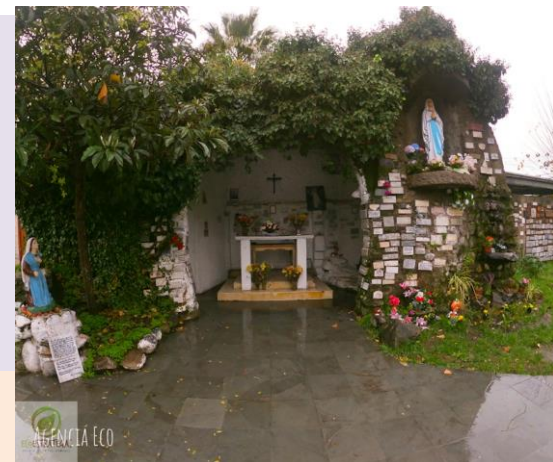
Imagen de la Virgen Nuestra Señora Lourdes Santuario de Linares.