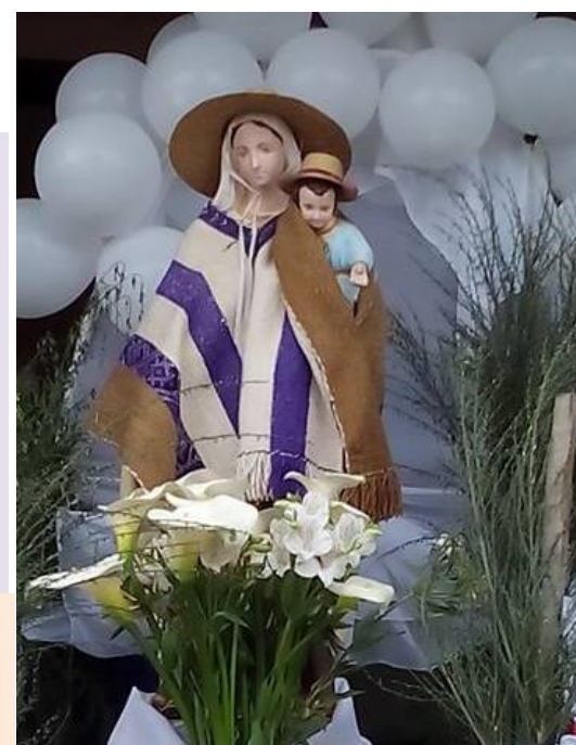
Imagen de la Virgen Campesina Linares.