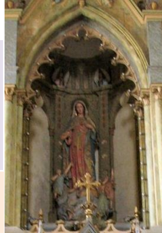
Imagen de la Virgen Del Corazón de María Linares.