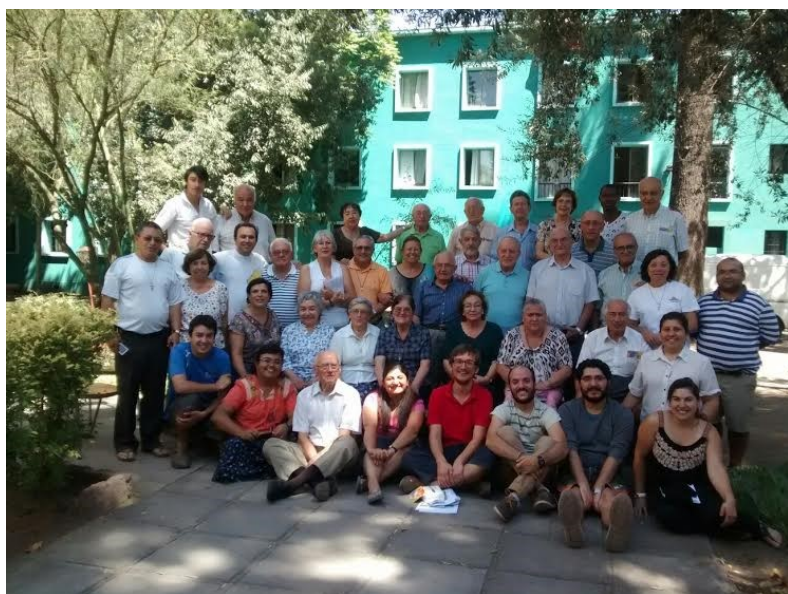
Encuentro de la Familia Marianista en Chile

El Futuro de las FMI lo veo con esperanza, aunque en Chile esta muy lenta la decisión de jóvenes para entrar a la vida Religiosa Marianista, no es así en otros países como África, India y Vietnam donde están respondiendo muchas jóvenes a este llamado. También me llena de alegría y esperanza las dos fundaciones fijadas du-