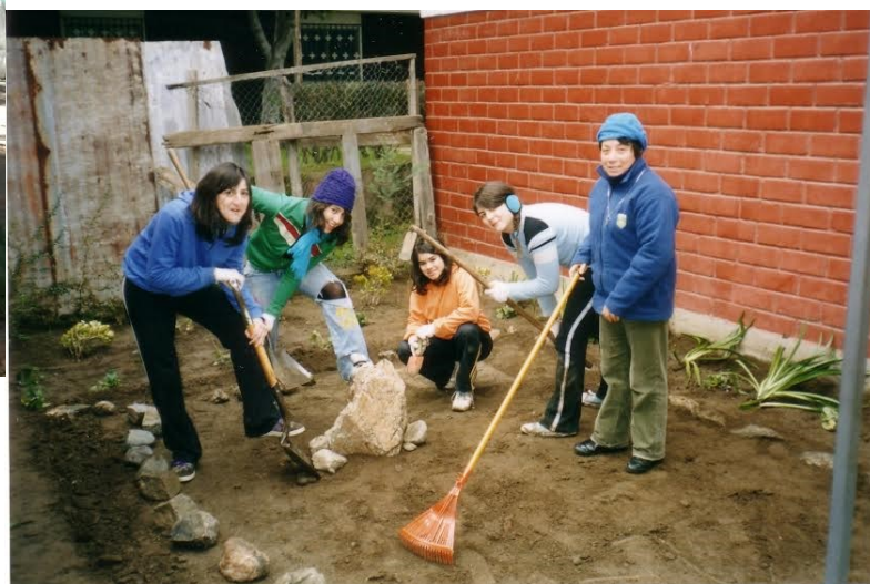
Labor en el Noviciado (Chile)

Comunidad: Encuentro Intercomunitario entre las