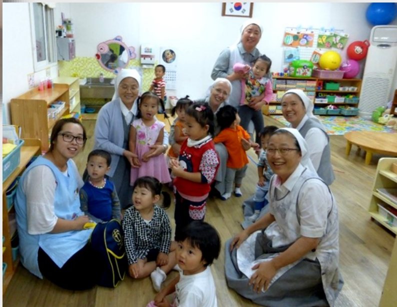
Nuestras hermanas coreanas dando clases a los niños del Jardín Infantil.